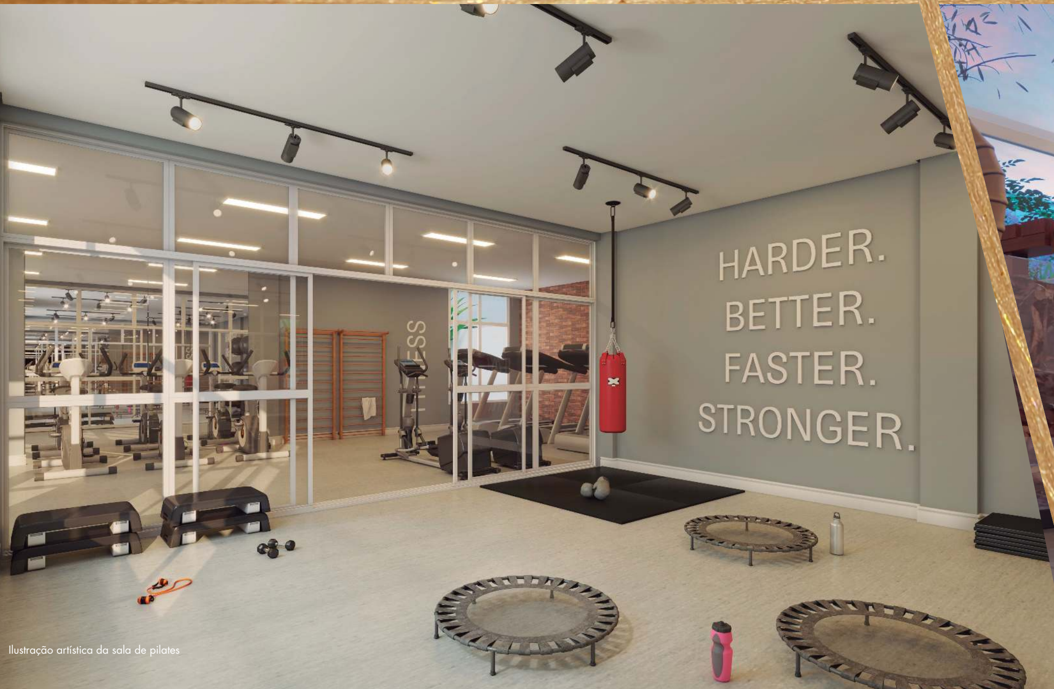
Ilustração artística da sala de pilates