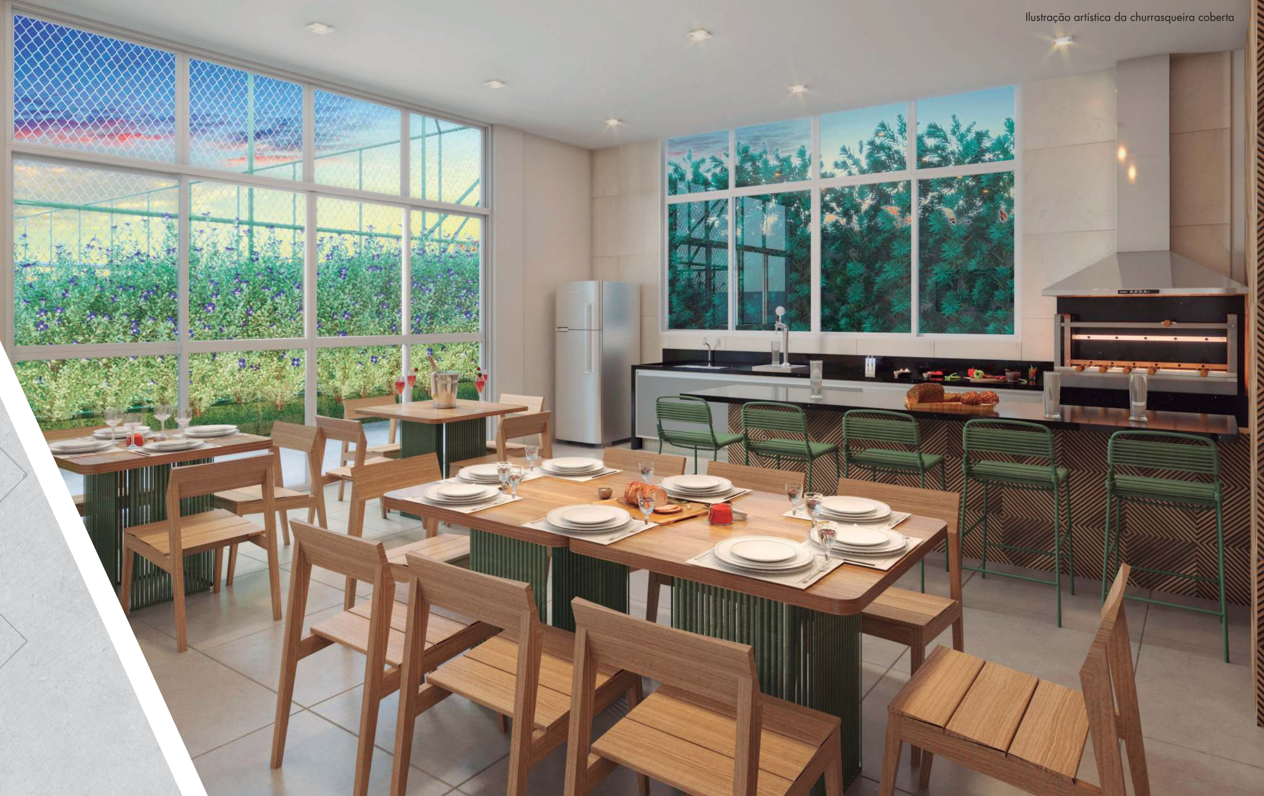
Ilustração artística do espaço gastronômico

Ilustração artística da churrasqueira coberta