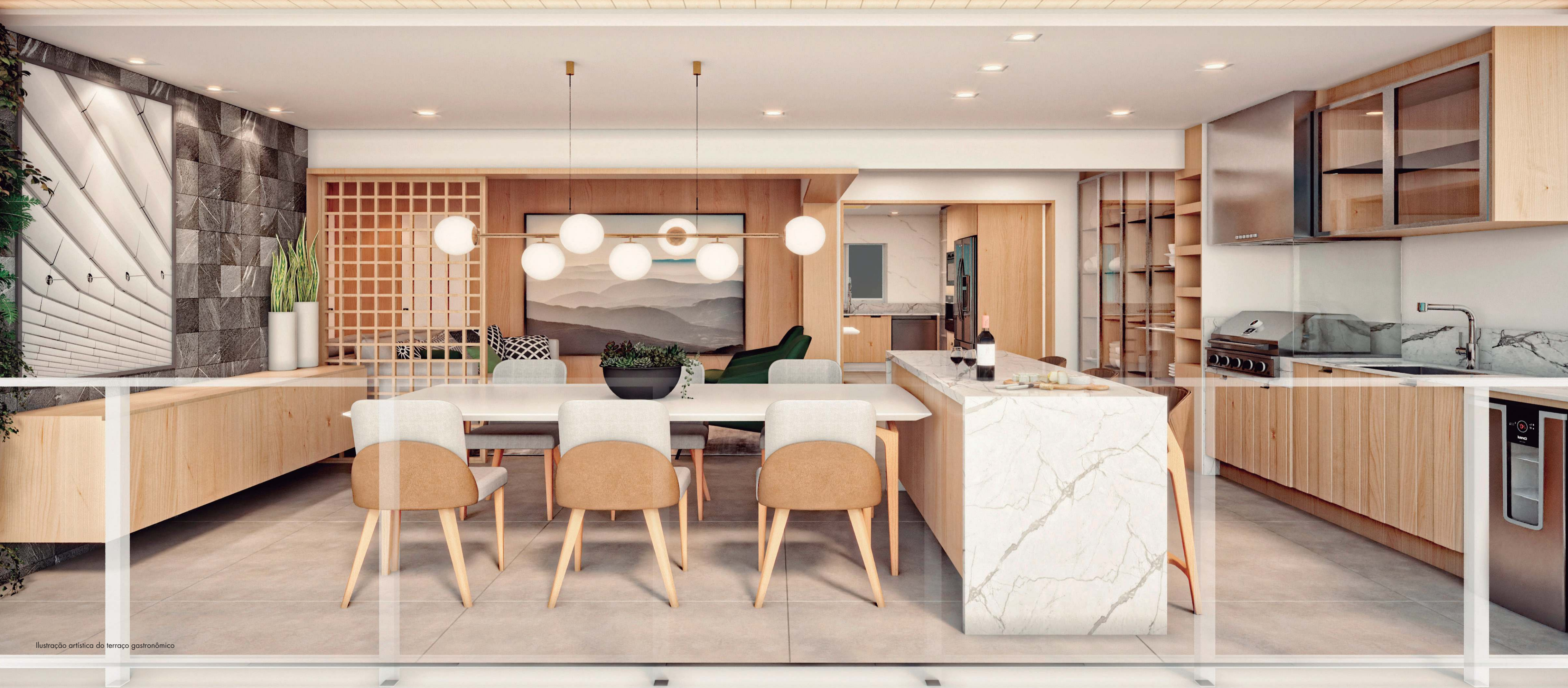
Ilustração artística do terraço gastronômico