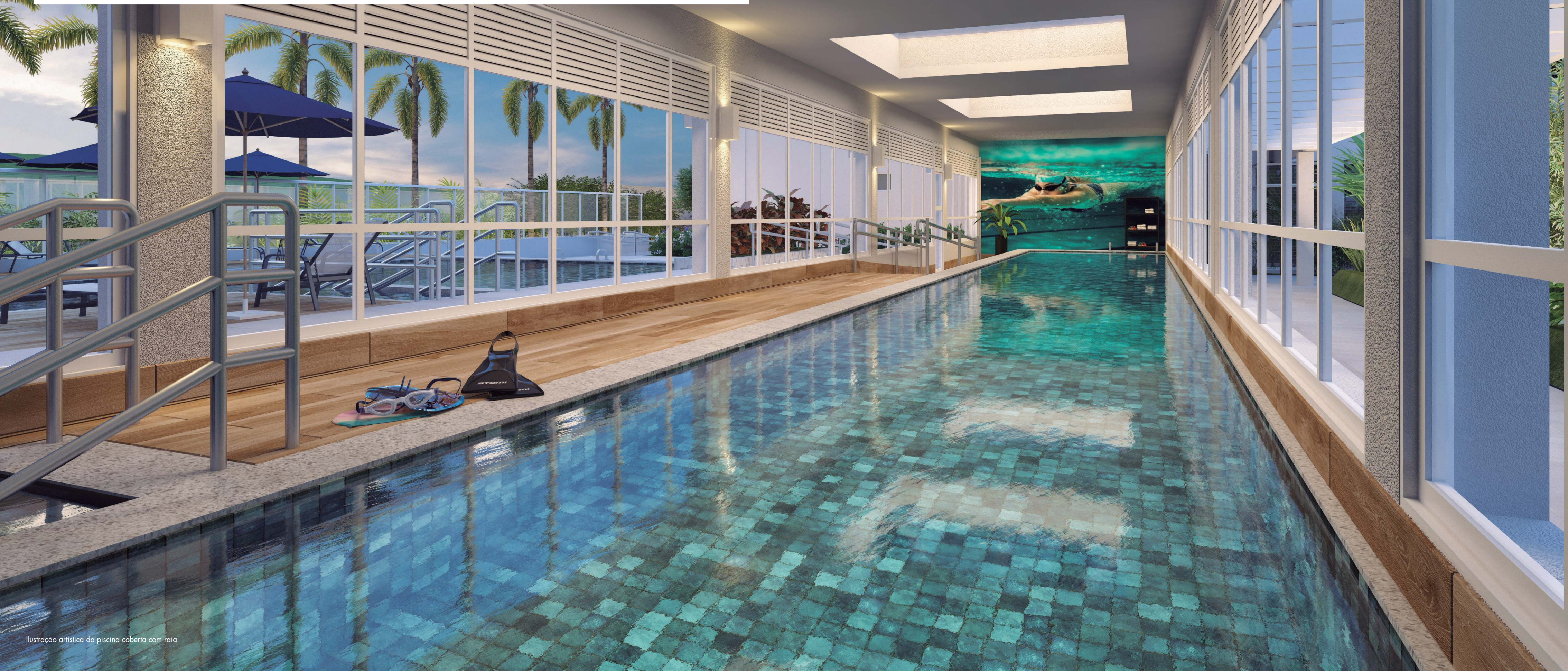
Ilustração artística da piscina coberta com raia