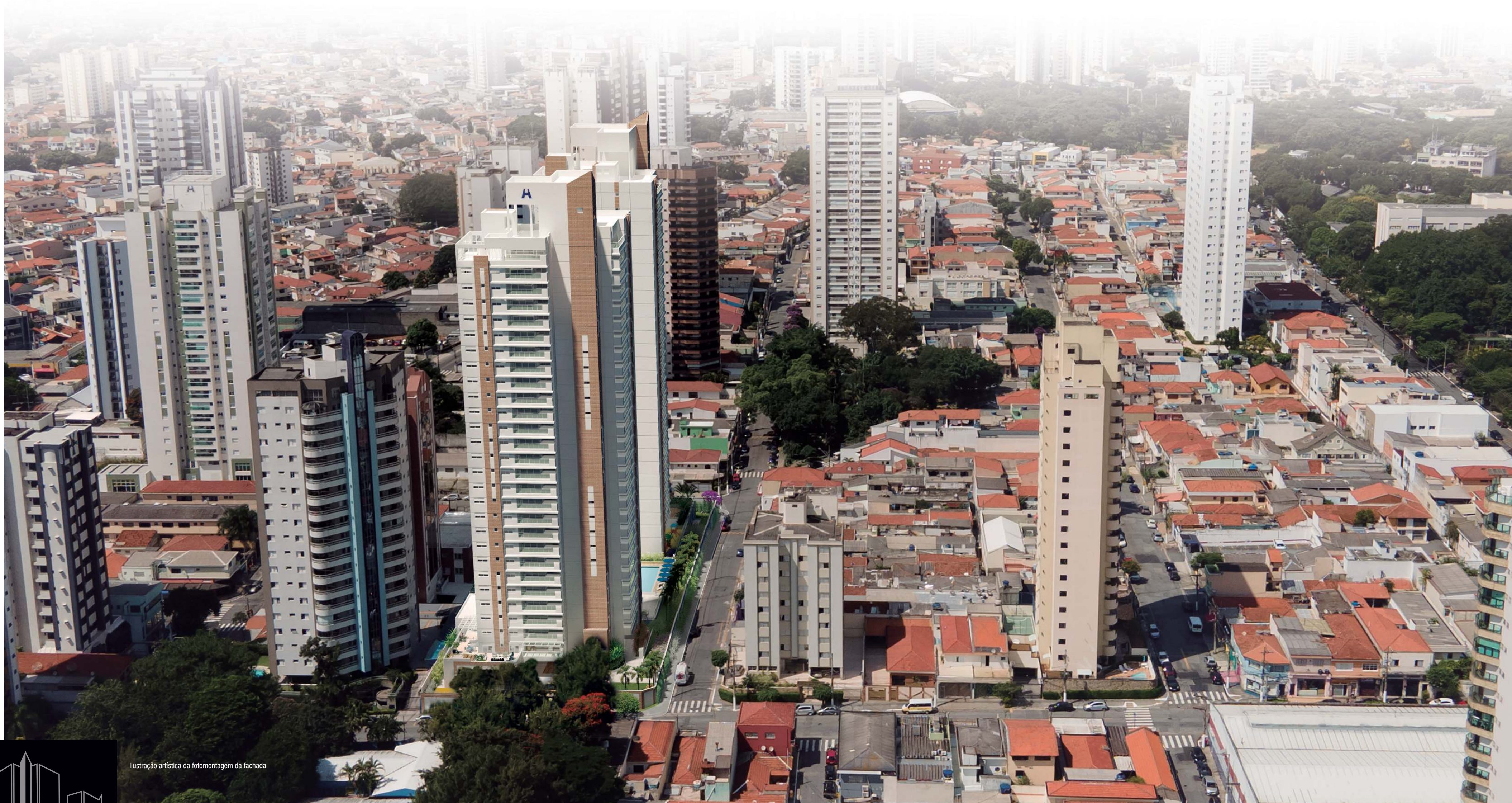
Ilustração artística da fotomontagem da fachada