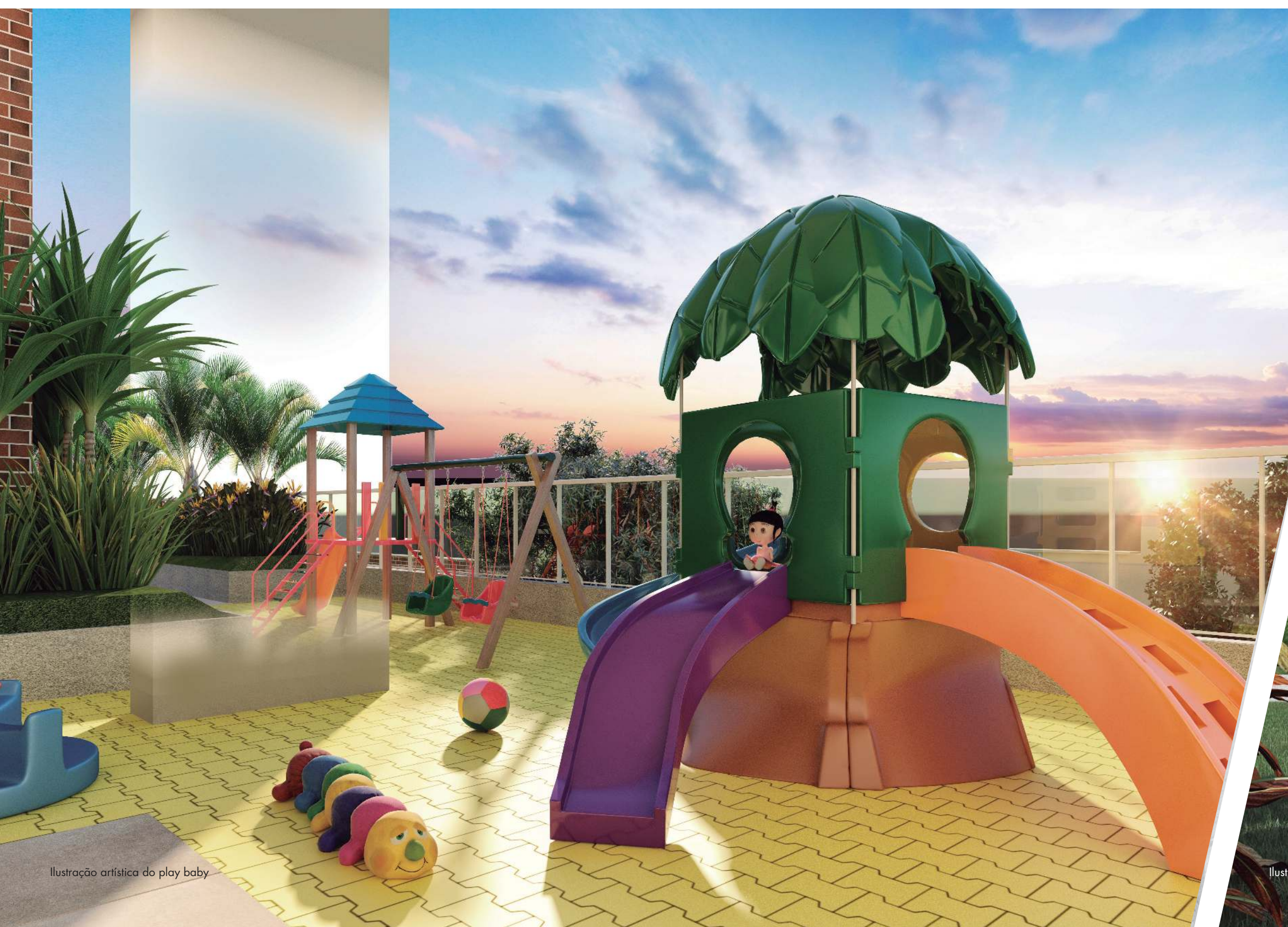
Ilustração artística do play baby