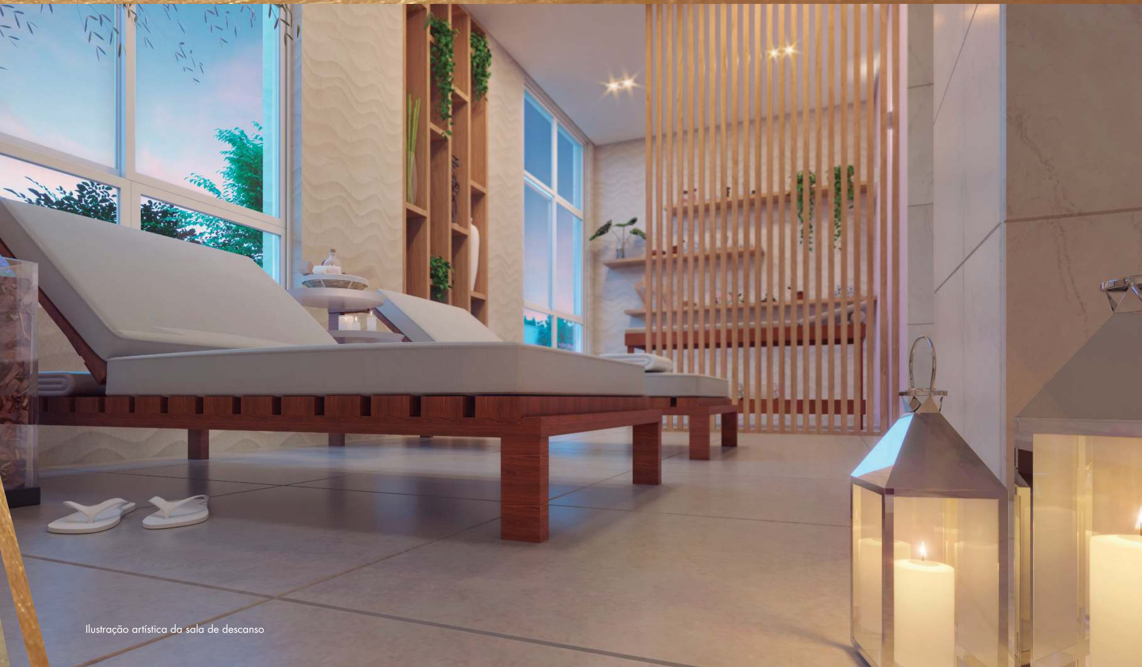
Ilustração artística da sala de descanso