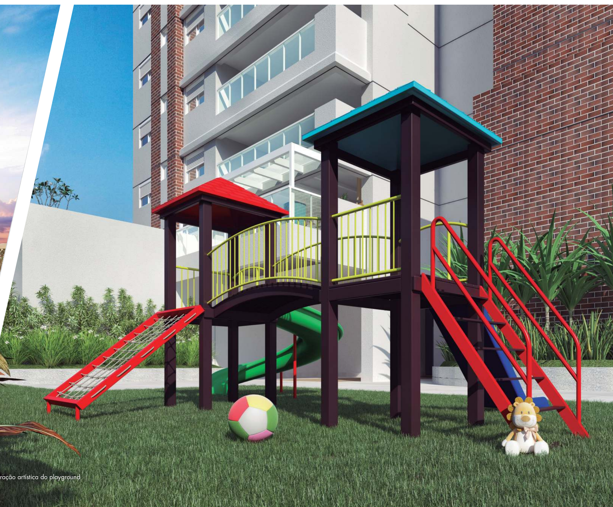
Ilustração artística do playground