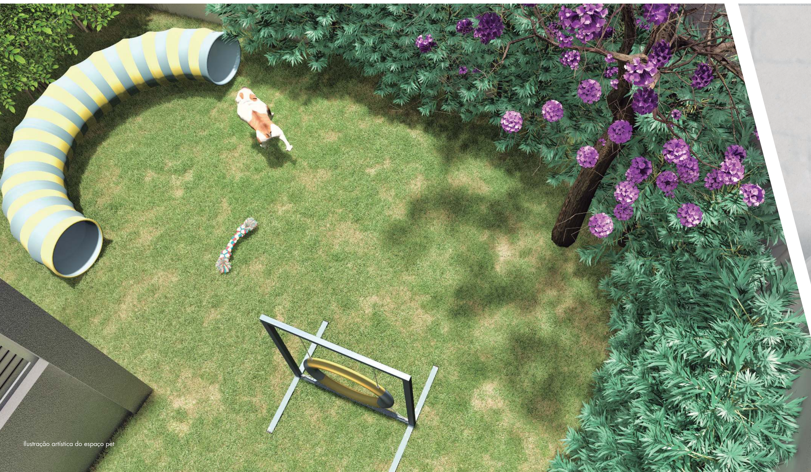
Ilustração artística do espaço pet