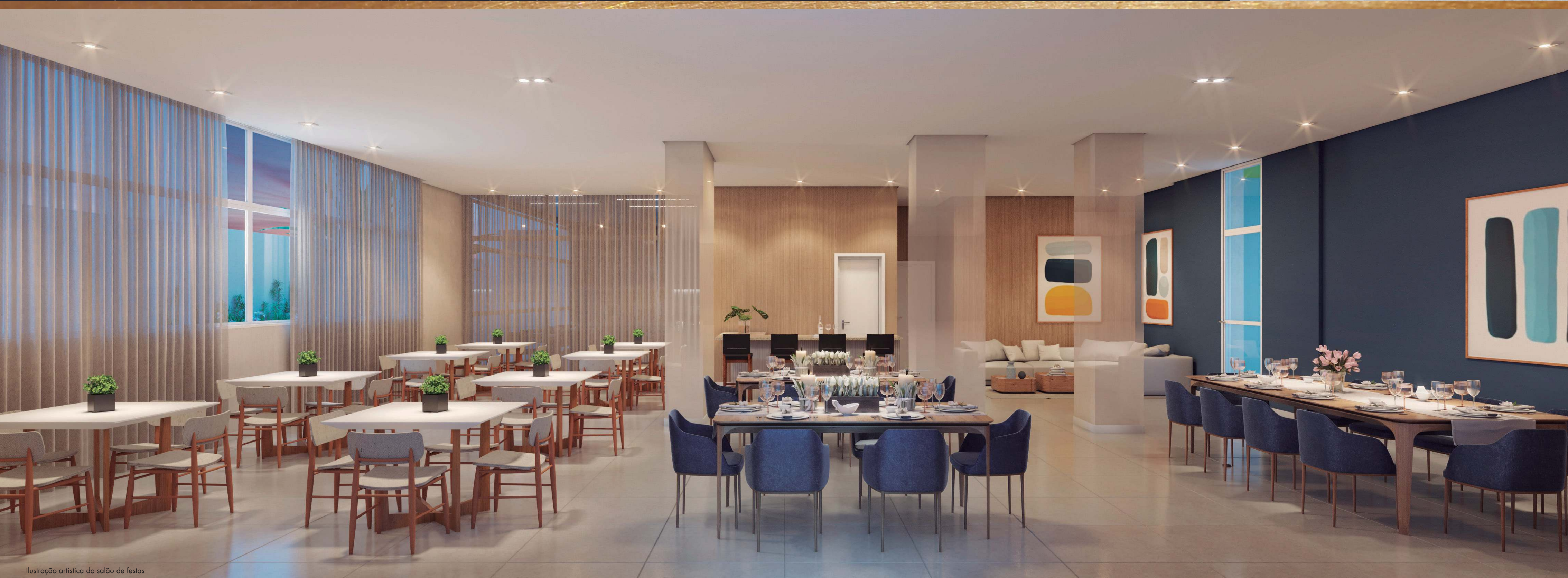
Ilustração artística do salão de festas