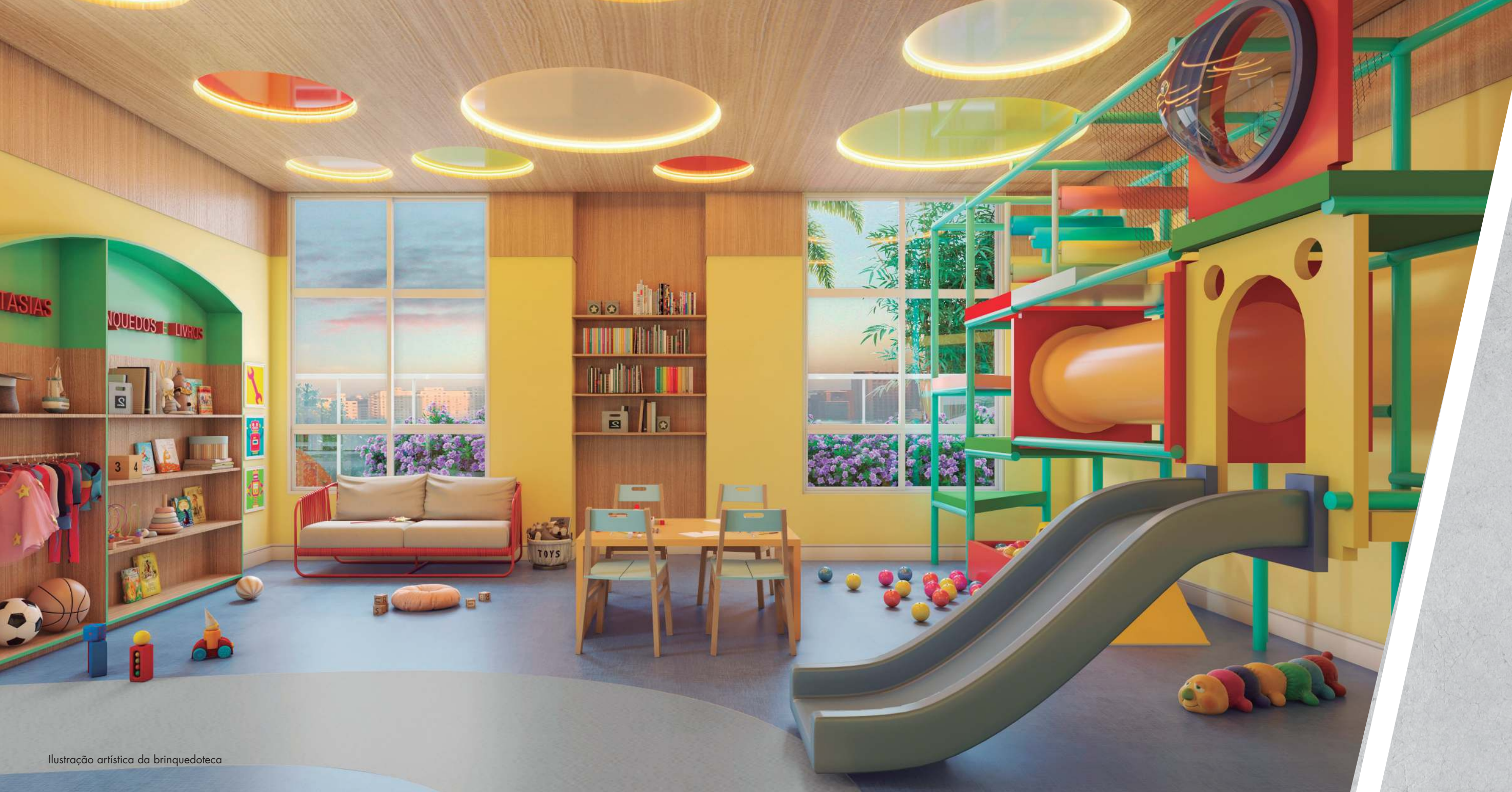
Ilustração artística da brinquedoteca