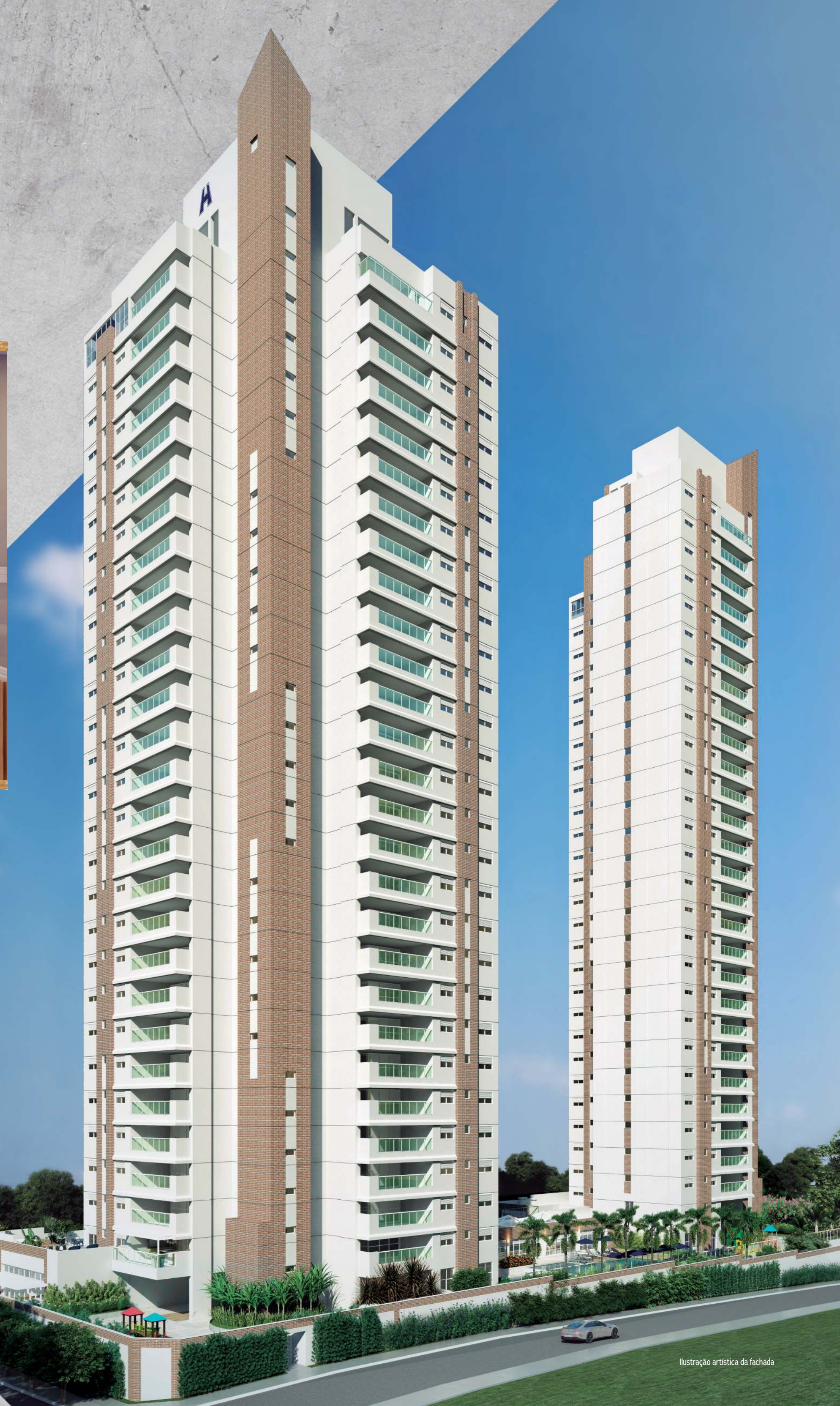
Ilustração artística da fachada