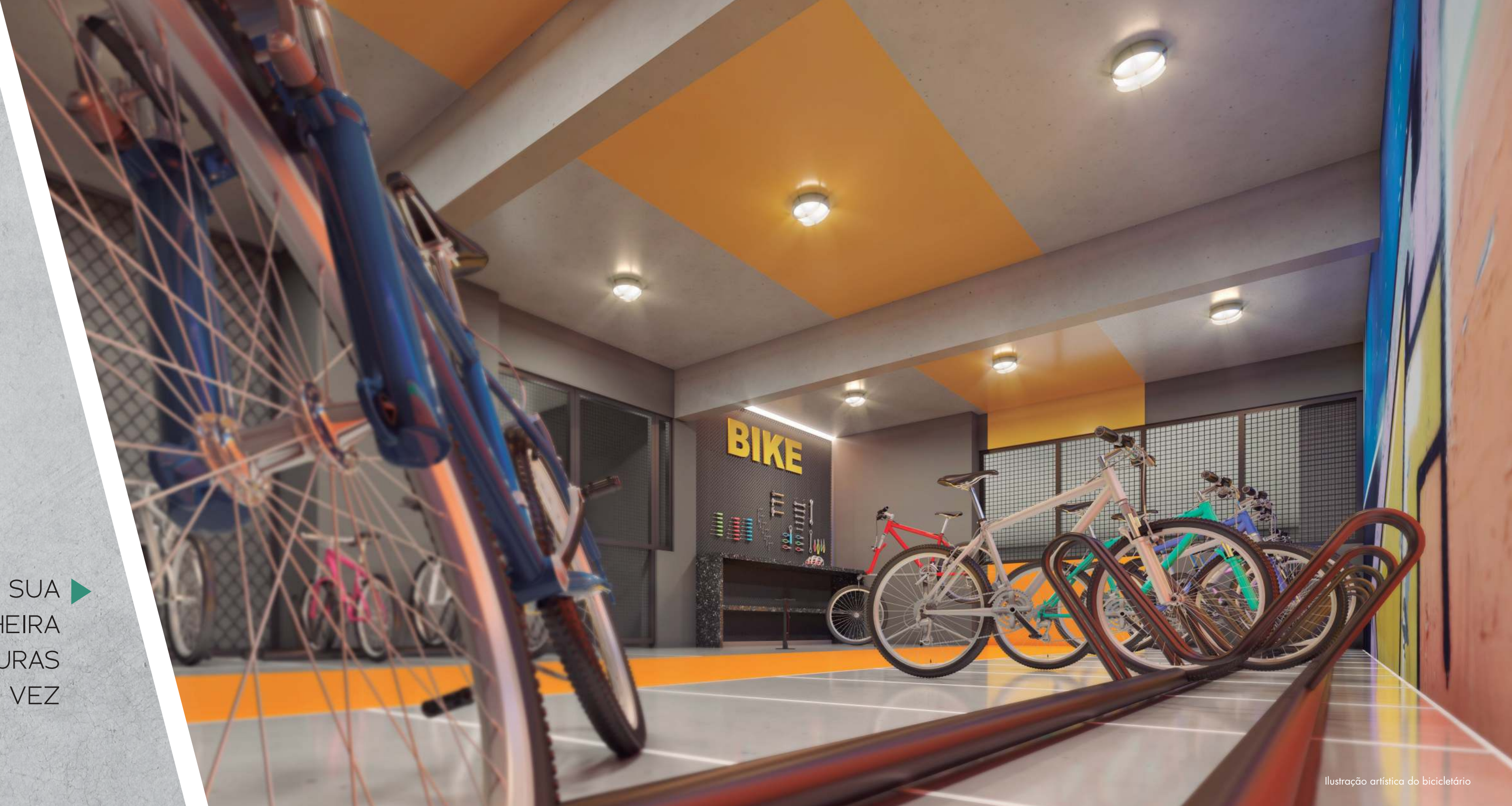
Ilustração artística do bicicletário

AQUI A SUA COMPANHEIRA DE AVENTURAS TAMBÉM TEM VEZ