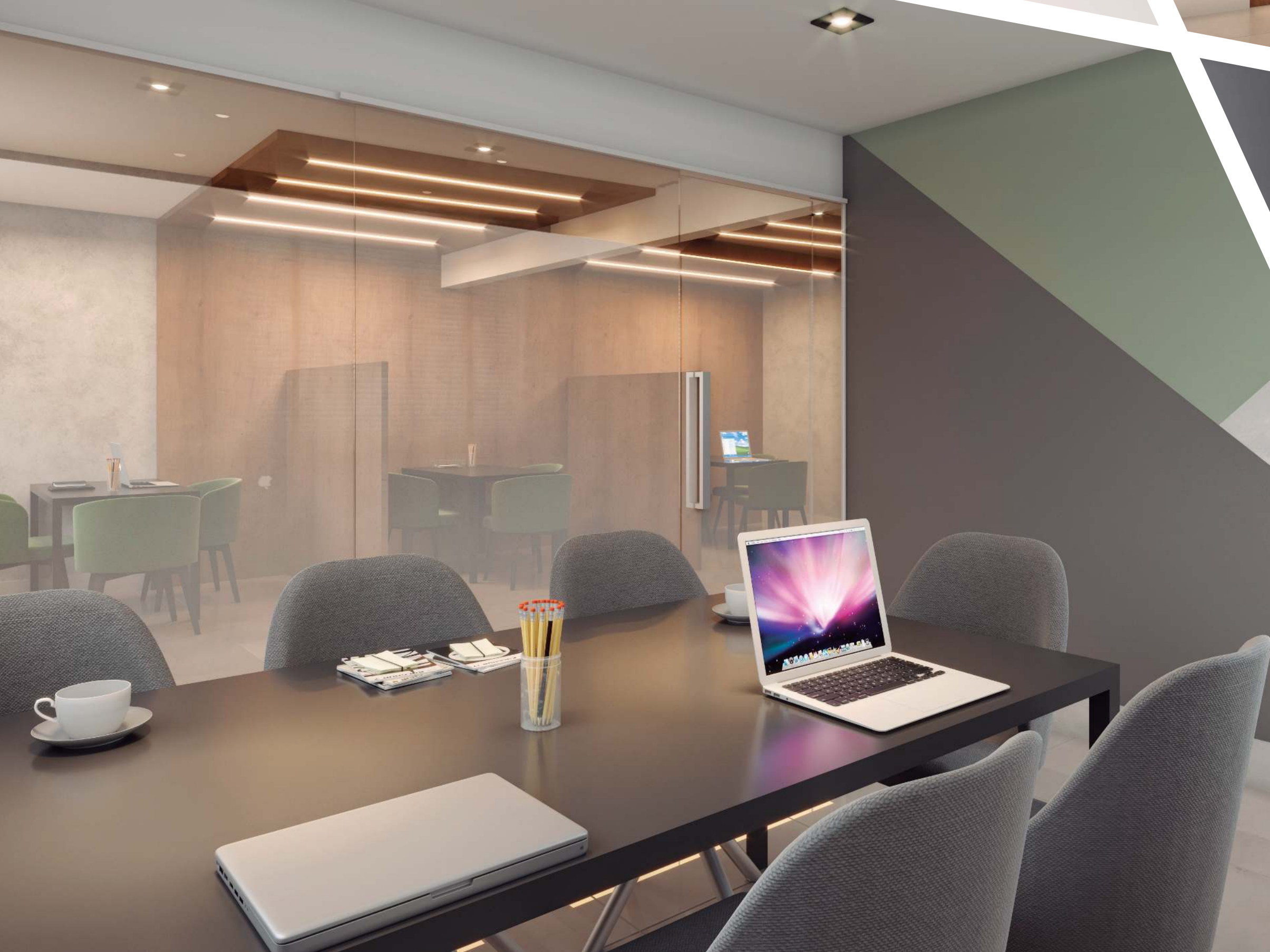
Ilustração artística do coworking