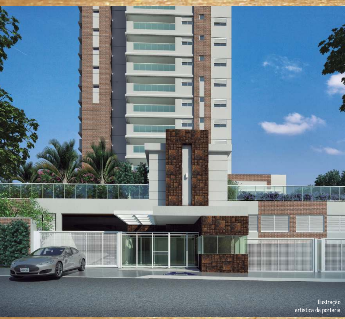
Ilustração artística da portaria