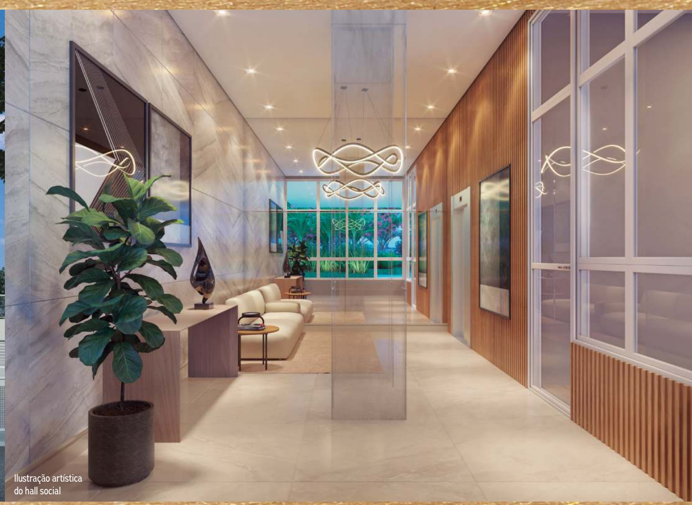
Ilustração artística do hall social