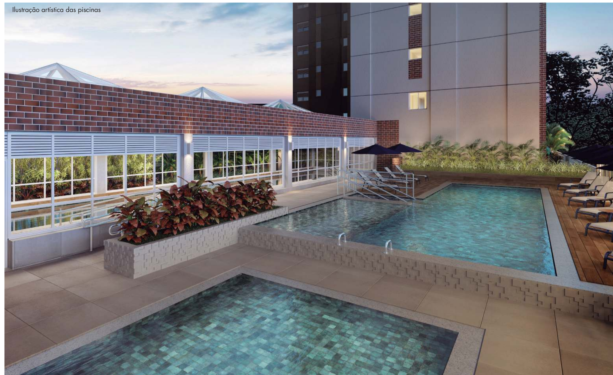
Ilustração artística das piscinas

A EXCLUSIVIDADE DE TER UM COMPLEXO AQUÁTICO A POUCOS PASSOS DO SEU APARTAMENTO