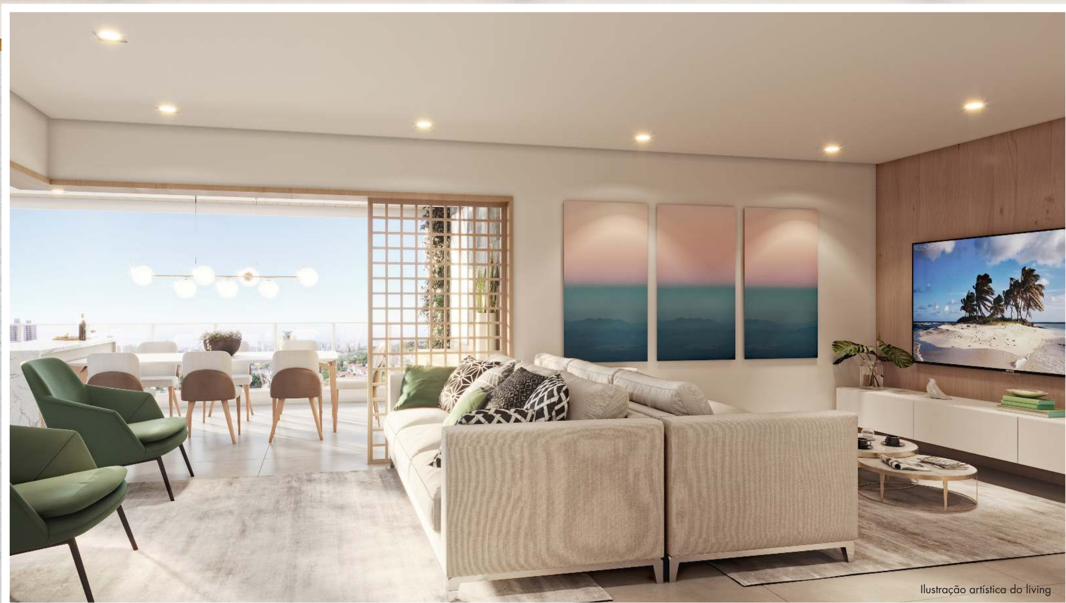
Ilustração artística do living