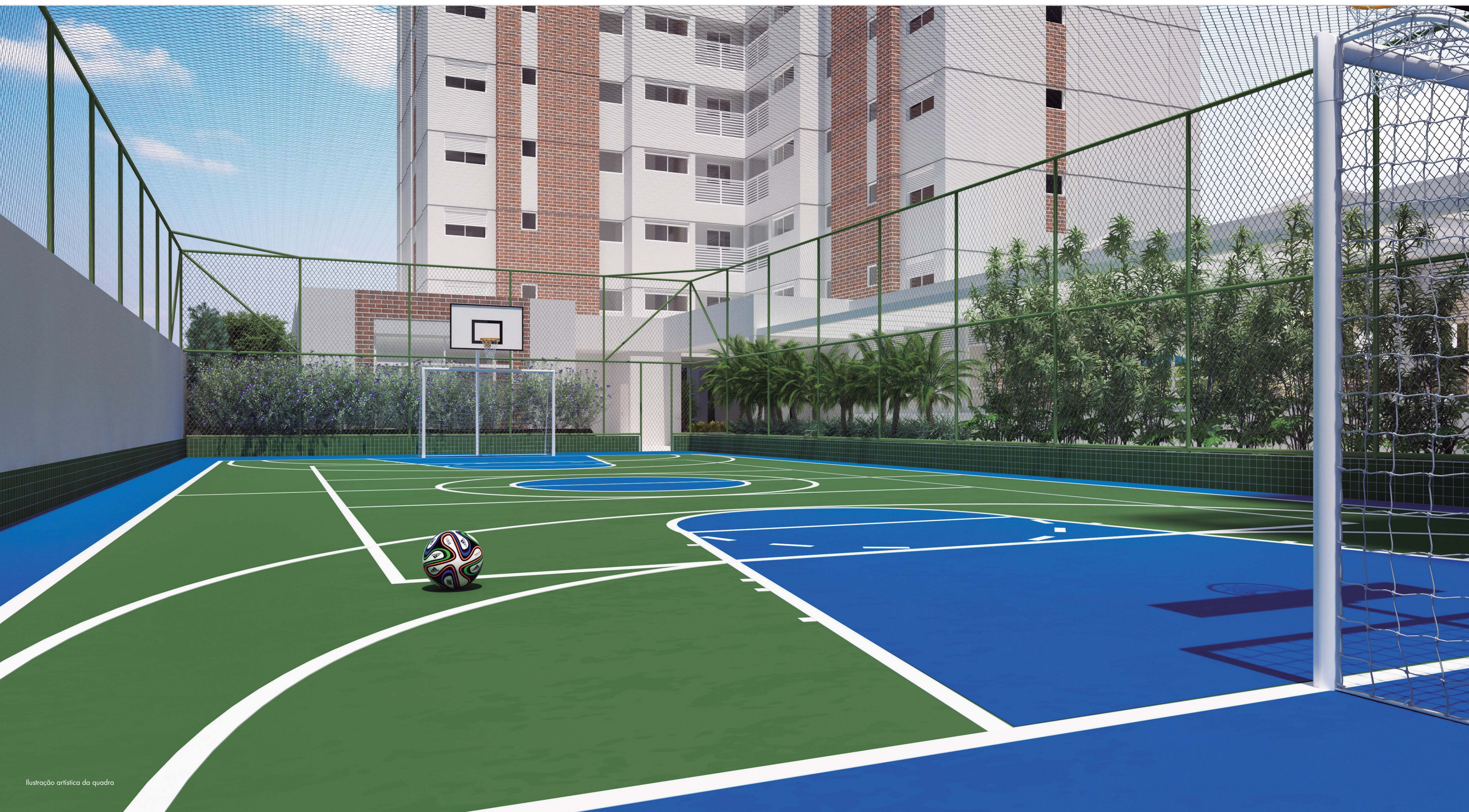
Ilustração artística da quadra